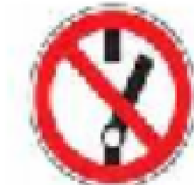
h. Tanda peringatan untuk tidak meng-ON-kan Saklar