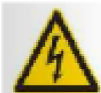
g. Tanda Peringatan terhadap bahaya Tegangan Listrik