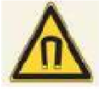
a. Tanda Bahaya