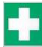
e. Tanda rumah sakit atau klinik kesehatan