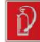
c. Tanda Perlindungan terhadap Kebakaran