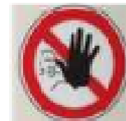
f. Tanda larangan