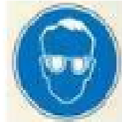
b. Tanda Anjuran